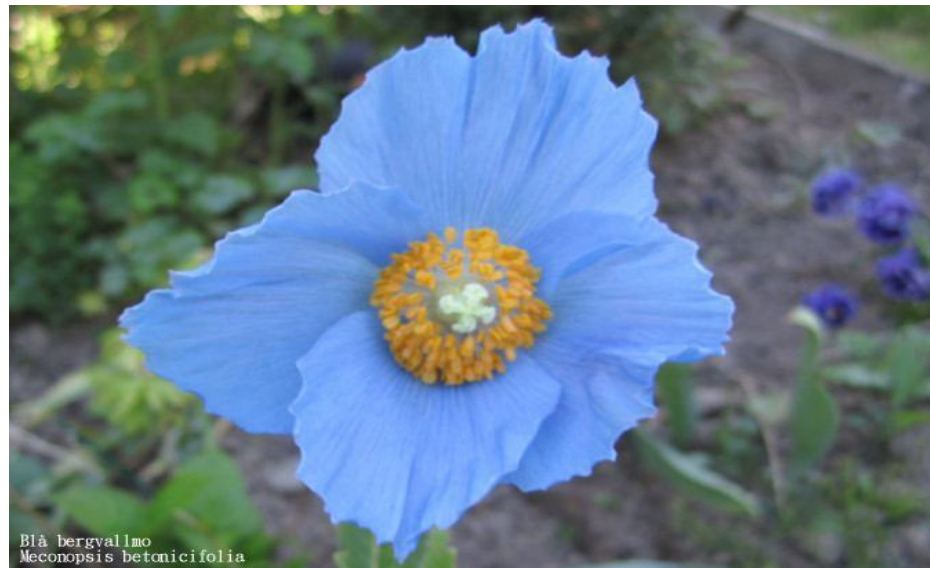
Blå bergvallmo Meconopsis betonicifolia